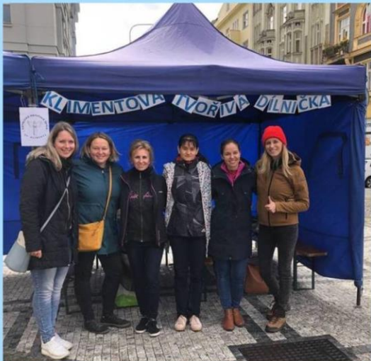
To jsme MY! Pedagogové, kteří jsou tady pro Vás a pro Vaše děti ze třídy...