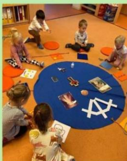
... v září jsme si povídali v rámci biblických chviliek o svatě Trojici, svatě Ludmile, svatému Václavovi...