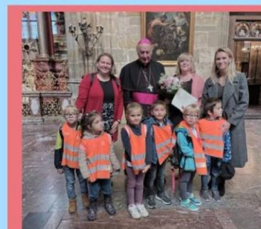
Předškoláci se zúčastnili mše svaté v rámci Dne církevního školství v katedrále sv. Víta, kterou celebroid arcibiskup pražský, mons. Jan Graubner. Potkali jsme se tam společně i s bývalou paní ředitelkou, která získala oceňení za její dlouholetou práci v církevním školství. Moc gratulujeme!