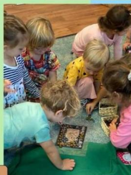
... děti si například ozdobil vlastní palladium země České..