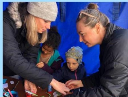
... s některými z Vás a Vašimi dětmi jsme se potkali na akci "Zažij město jinak"