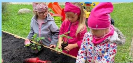
Děti pomáhají zkrášlovat naši zahradu a aktivně se zapojily do sázení jahod, meduňky, narcisů a zasely řeřichu a polníček. To jsou naši malí zahradníci.